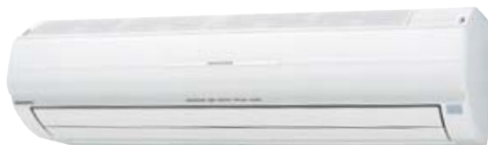
AWHZ14L, AWHZ18L, AWHZ24L